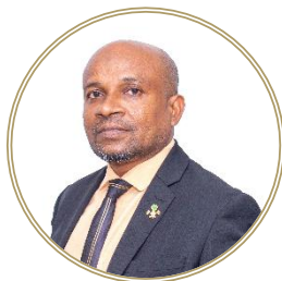
تاریخی دستاویز 10 دستاویزی در دسترس قرار گرفته است