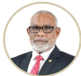
تاریخی دستاویز 10 دستاویزی در دسترس قرار گرفته است