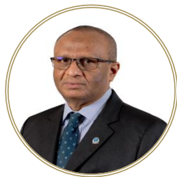
تاریخی دستاویز 10 دستاویزی در دسترس قرار گرفته است