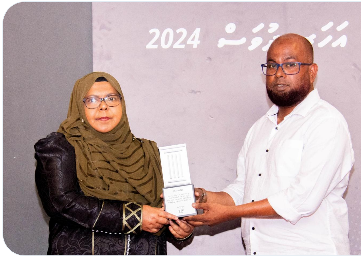
رئیس هیئت مدیره دهم مرکز