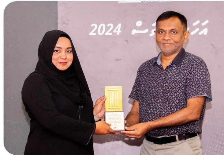
رڪارڊر ڊوڪيومينٽري ٽي وي پروگرام