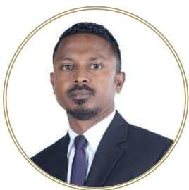
تاریخی دستاویز 10 دستاویزی در دسترس قرار گرفته است