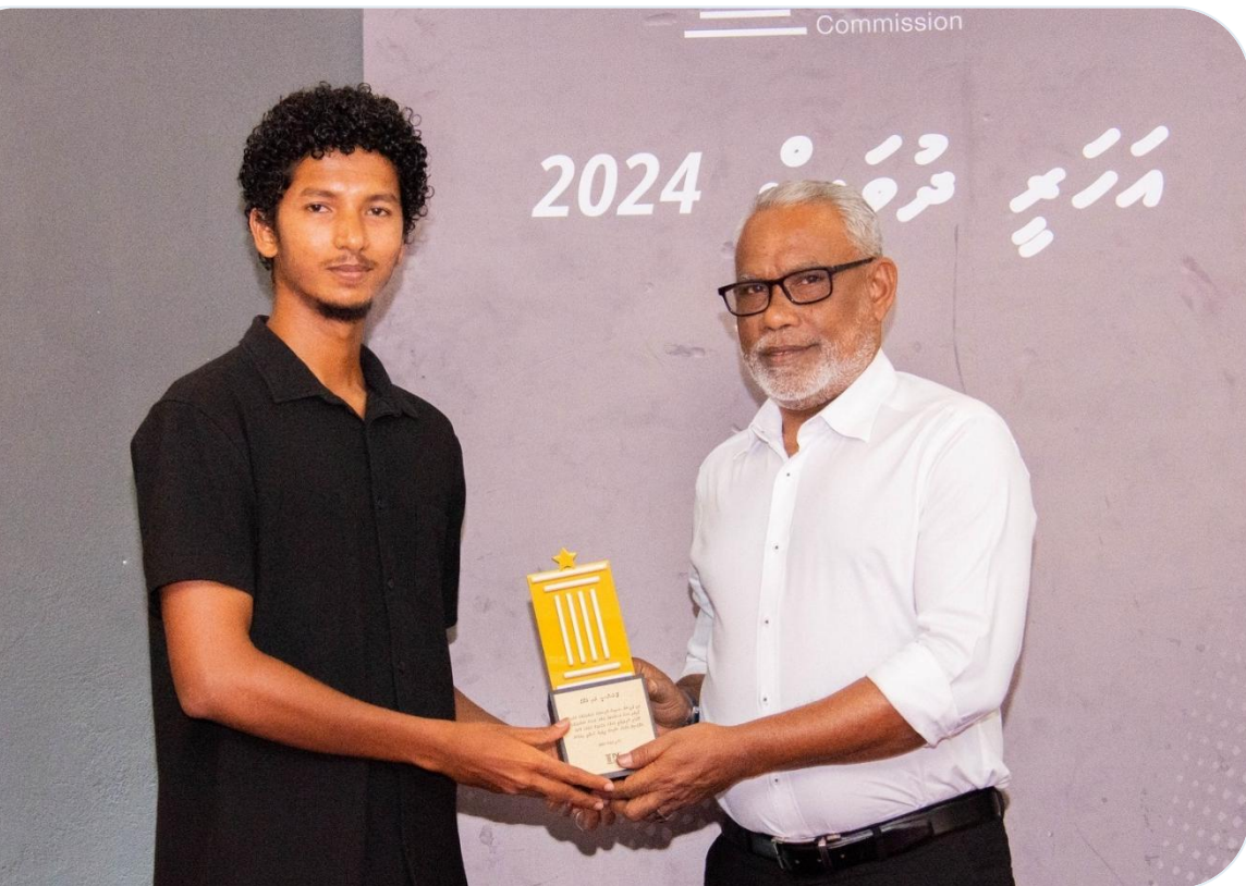
رئیس هیئت مدیره نهم مرکز