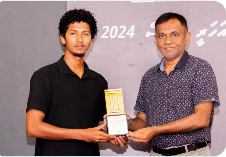
رڪارڊر ٽي وي پروگرام