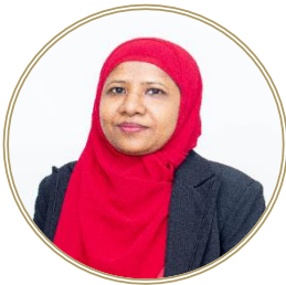
تاریخی دستاویز 10 دستاویزی در دسترس قرار گرفته است