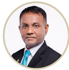
تاریخی دستاویز 10 دستاویزی در دسترس قرار گرفته است