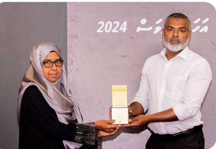
رڪارڊر ڊوڪيومينٽري ٽي وي پروگرام