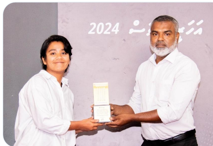
رڪارڊر ڊوڪيومينٽري ٽي وي پروگرام